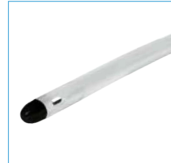
Nelatonspitze, integral Ballon