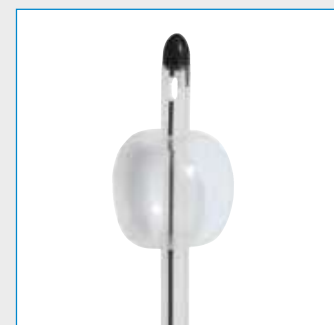
Ballonvolumen: 03-10 ml

Abbildungen können vom Original abweichen